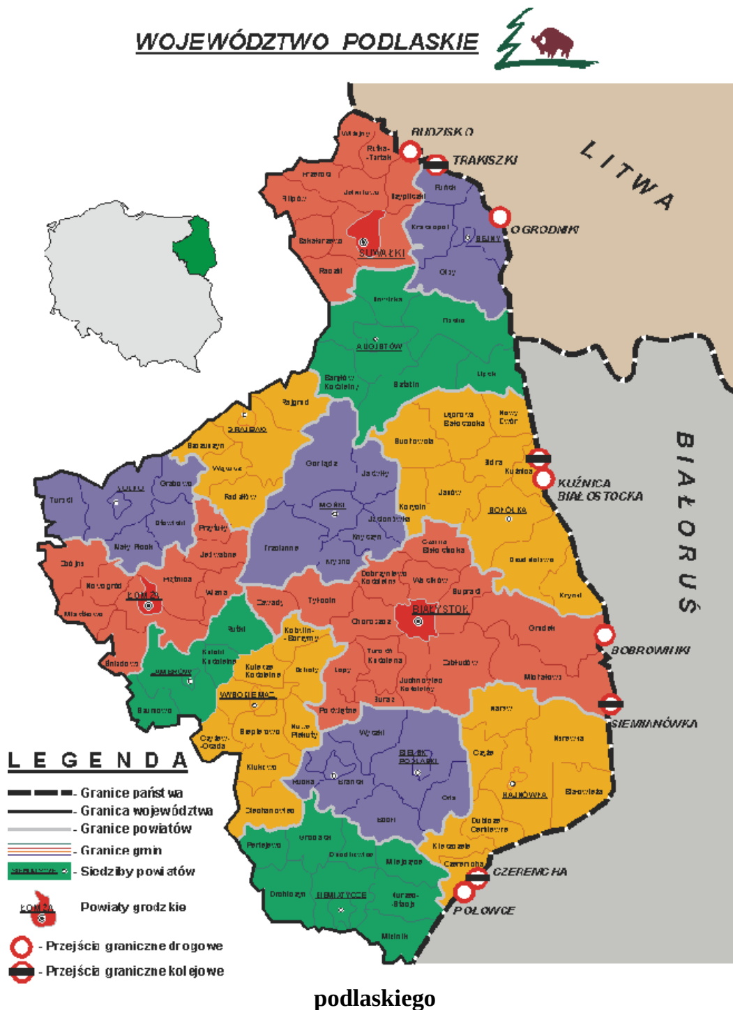
Rysunek nr 2 Położenie gminy Klukowo i powiatu wysokomazowieckiego na tle województwa

Położenie gminy Klukowo i powiatu wysokomazowieckiego na tle województwa podlaskiego przedstawia poniższa mapa na Rysunku nr 2 .