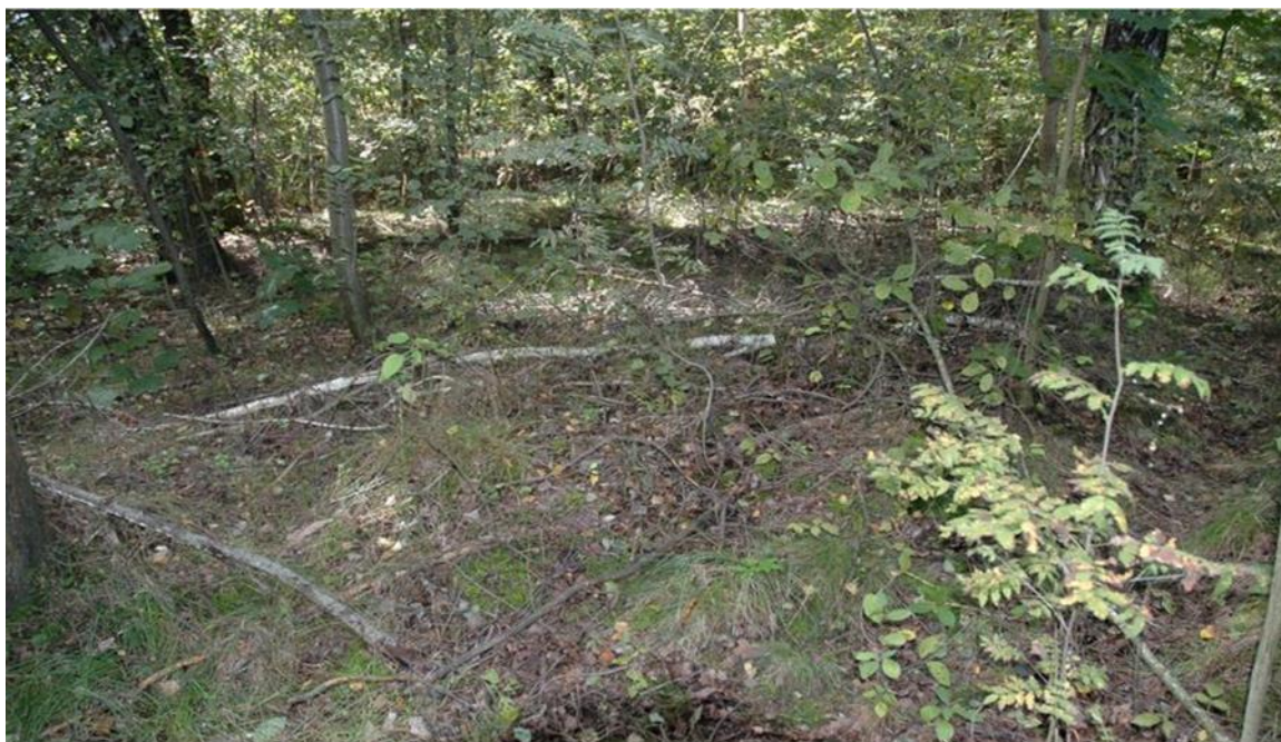
Lubowicze Byzie, gm. Klukowo. Cmentarz wojenny z okresu I wojny światowej.

Cmentarz żołnierzy niemieckich i rosyjskich położony około 20 metrów od skraju lasu i drogi Wyszonki Kościelne-Klukowo. Założony około 1915 roku. Układ kwater nieczytelny. Bardzo słabo czytelne ślady trzech pojedynczych mogił i jednej większej