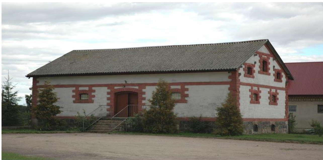
Gródek, gm. Klukowo. Spichlerz w zespole dworsko - parkowym.