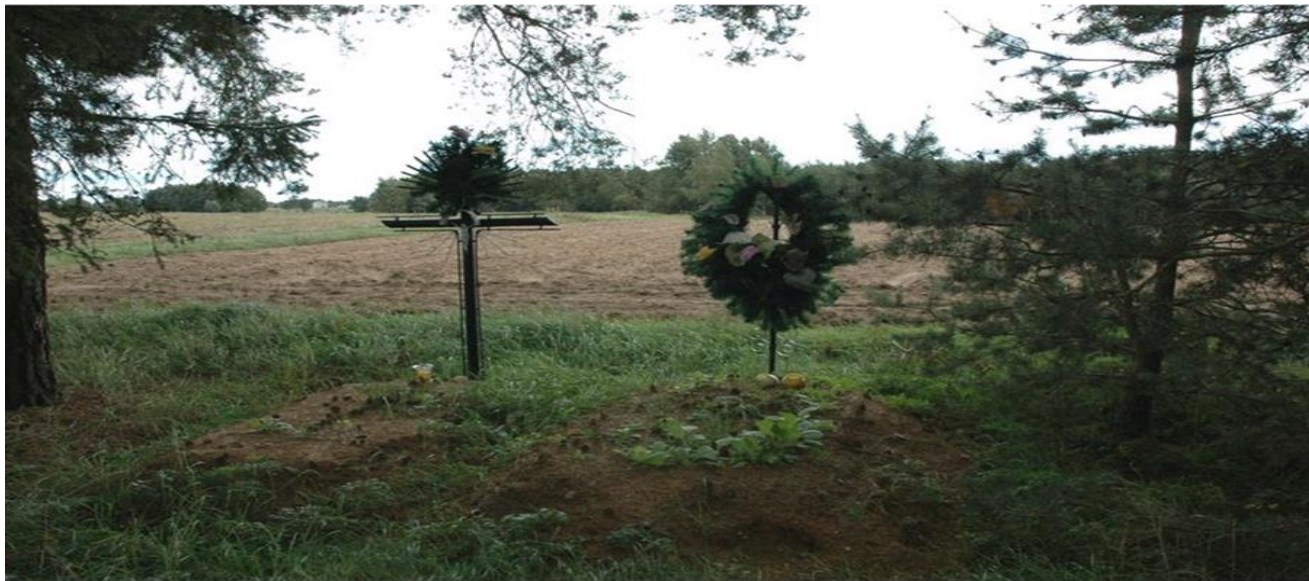
Kostry Podsędkowięta, gm. Klukowo. Cmentarz wojenny z okresu I wojny światowej.

Cmentarz położony na północnym skraju wsi, otoczony polami, od zabudowań oddalony o około 1 kilometr, a od drogi Kuczyn-Wyszonki Kościelne około 60 metrów. Założony około 1915 roku. Zarys grobów i mogił nieczytelny. Obecnie na terenie cmentarza usypane współcześnie dwie mogiły z krzyżami bez tabliczek. Bardzo słabo czytelne ślady wału ogrodzeniowego. Teren cmentarza porośnięty lasem sosnowym.