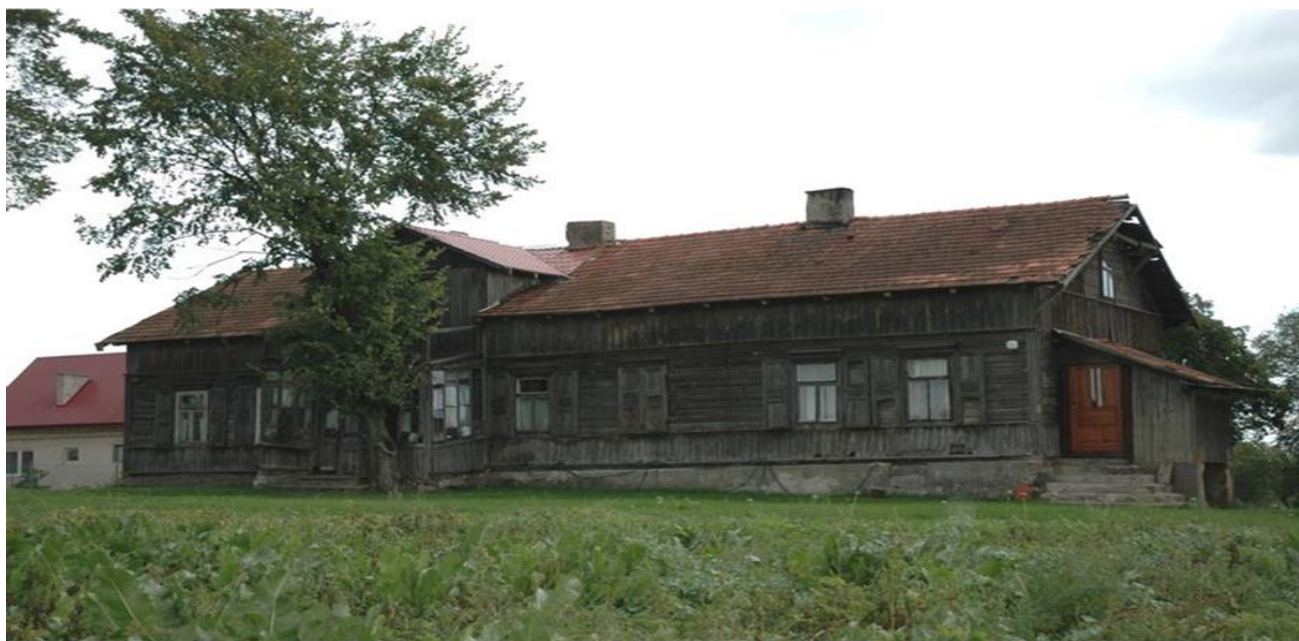
Gródek, gm. Klukowo. Dwór w zespole dworsko - parkowym.