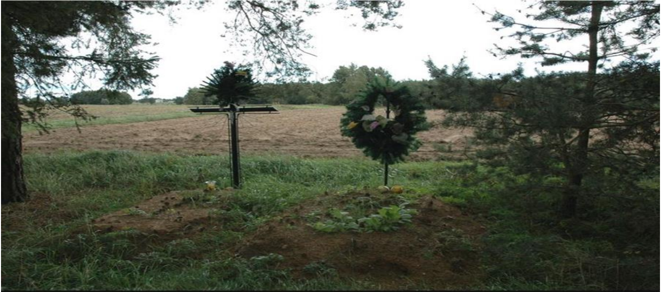
Kostrzy Podśędkowięta, gm. Klukowo. Cmentarz wojenny z okresu I wojny światowej.

Cmentarz położony na północnym skraju wsi, otoczony polami, od zabudowań oddalony o około 1 kilometr, a od drogi Kuczyn-Wyszonki Kościelne około 60 metrów. Założony około 1915 roku. Zarys grobów i mogił nieczytelny. Obecnie na terenie cmentarza usypane wspólnie dwie mogiły z krzyżami bez tabliczek. Bardzo słabo czytelne ślady wału ogrodzeniowego. Teren cmentarza porośnięty lasem sosnowym.