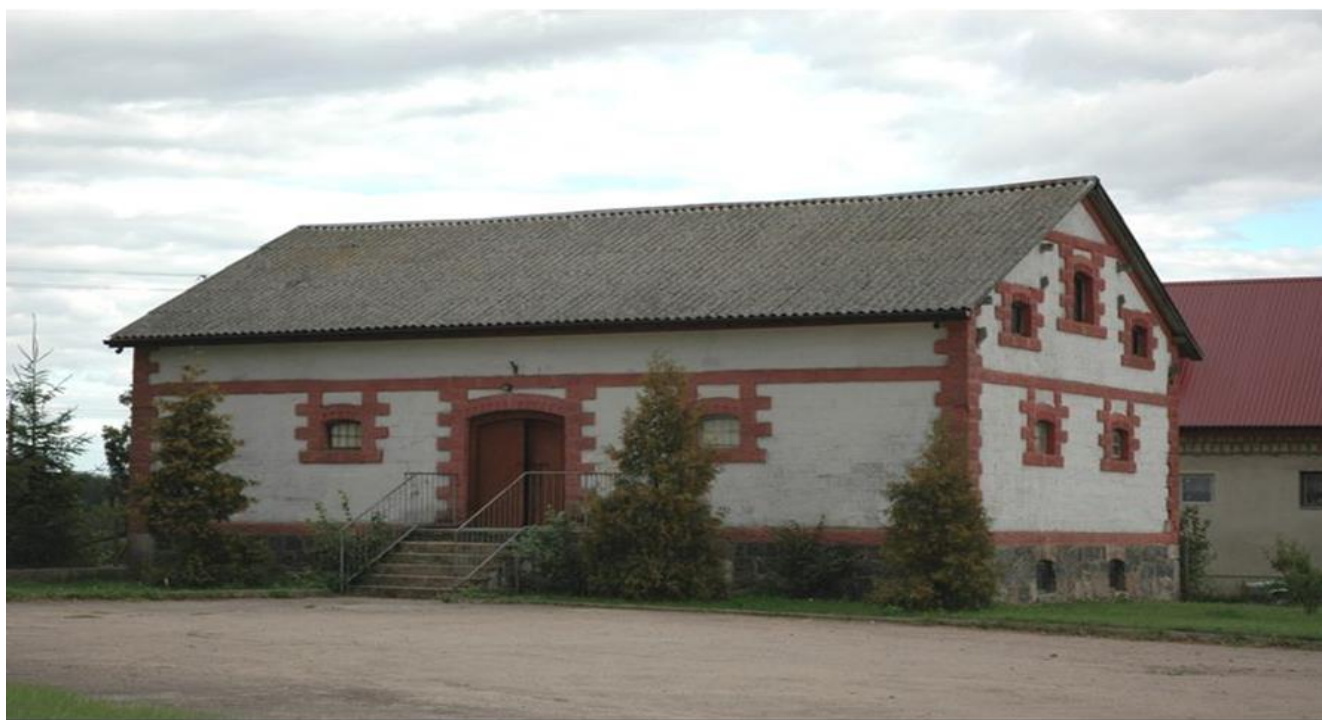
Gródek, gm. Klukowo. Spichlerz w zespole dworsko - parkowym.