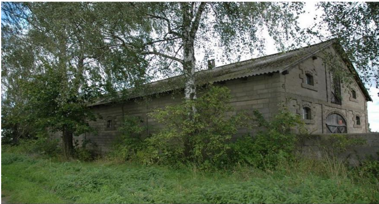
Gródek, gm. Klukowo. Obora II w zespole dworsko - parkowym.

Dwór prawdopodobnie zbudowano w II połowie XIX wieku. Budynek drewniany, jednokondygnacyjny osadzony na wysokim fundamencie niwelującym nierówności terenu. Obiekt oszalowany deskami, do wysokości okien i powyżej nich pionowo, natomiast na linii okien poziomo. Szczyty oszalowane deskami wielokierunkowo. Od frontu asymetryczny ganek wejściowy, nad nim wałący się balkon. Od strony jednego ze szczytów przybudówka z drzwiami wejściowymi. Dach dwuspadowy kryty dachówką ceramiczną. Dwór obecnie zamieszkały, mocno zaniedbany.