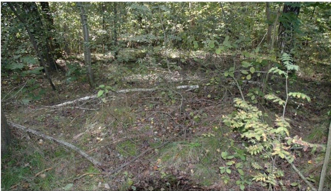
Lubowicze Byzie, gm. Klukowo. Cmentarz wojenny z okresu I wojny światowej.

Cmentarz żołnierzy niemieckich i rosyjskich położony około 20 metrów od skraju lasu i drogi Wyszonki Kościelne-Klukowo. Założony około 1915 roku. Układ kwater nieczytelny. Bardzo słabo czytelne ślady trzech pojedynczych mogił i jednej większej mogiły. Teren cmentarza całkowicie porośnięty lasem brzoźowo-lipowym. Cmentarz zachowany szczątkowo.